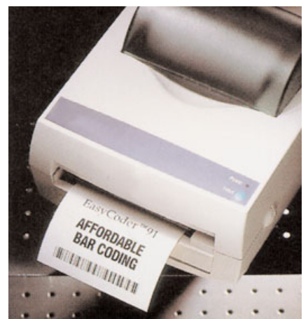
Barcode Drucker – gestochen scharfes Druckbild dank innovativer Thermo-Transfertechnik.

Mausklick bestellt. Der IPRO-Einkauf verspricht: „Bestellungen, die bis 14 Uhr per Internet eingehen, werden noch am selben Tag versendet.“ Wer diese rationelle Form der Auftragsabwicklung wählt, erhält außerdem einen „Online-Besteller-Rabatt“ von fünf Prozent auf den Gesamtwarenwert. Wer noch keinen Internet-Zugang hat und herkömmlich bestellen will, erhält auf Anfrage eine vollständige Liste aller lieferbaren Zubehörartikel.