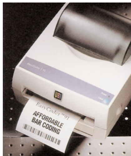
UBI-Barcode Drucker – gestochen scharfes Druckbild dank der innovativen Thermotransfertechnik.

verspricht: „Bestellungen, die bis 14 Uhr per Internet eingehen, werden noch am selben Tag versendet.“ Wer diese rationelle Form der Auftragsabwicklung wählt, erhält außerdem einen „Online-Besteller-Rabatt“ von fünf Prozent auf den Gesamtwarenwert. Wer noch keinen Internet-Zugang hat und herkömmlich bestellen will, erhält auf Anfrage eine vollständige Liste aller lieferbaren Zubehörartikel.