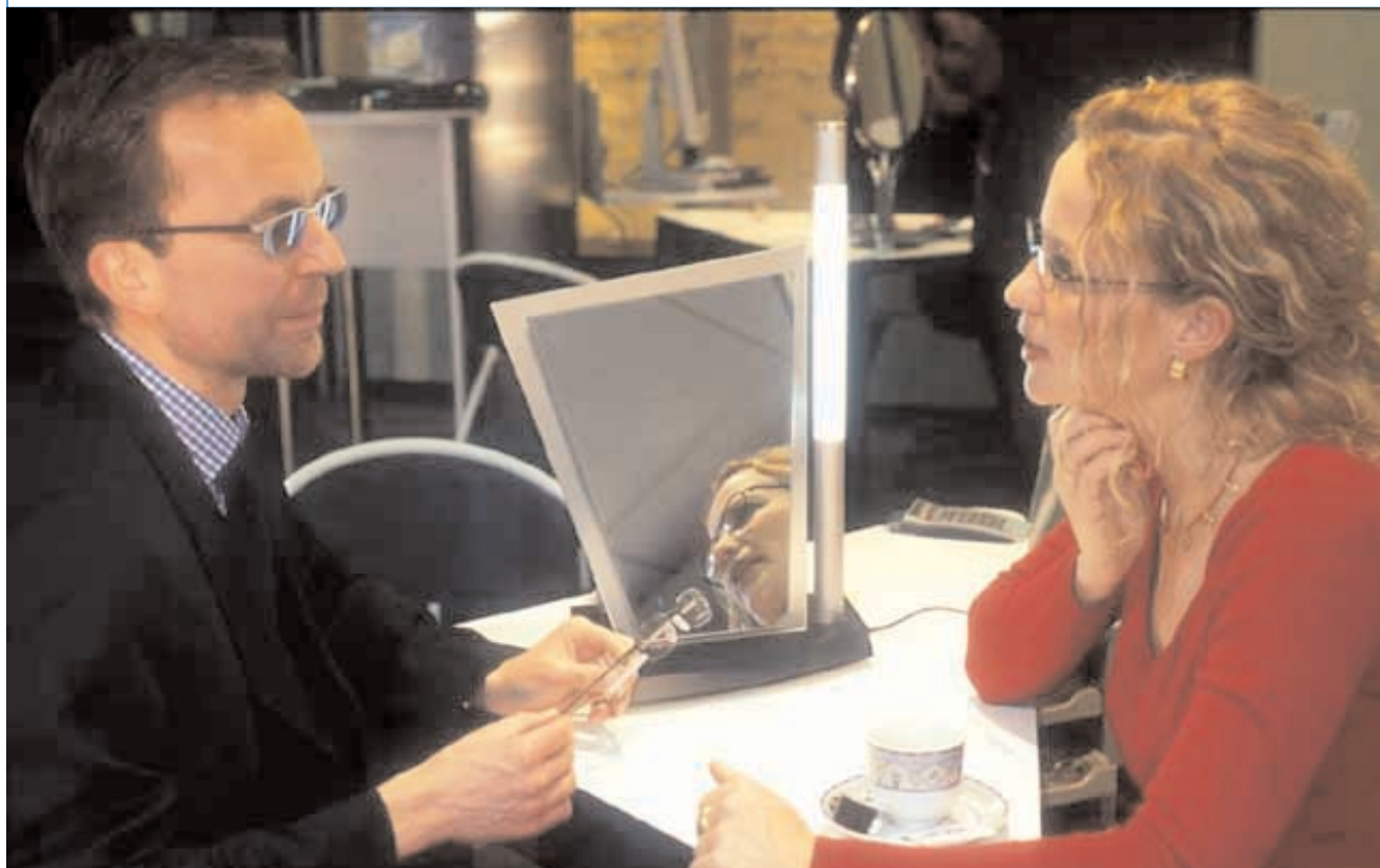
magicLOOK V.3 und magicMIRROR – die Videoberatung von IPRO.