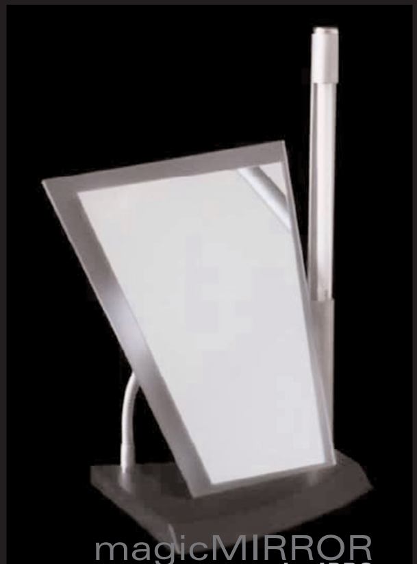
magicMIRROR by IPRO

magicMIRROR: Ein preiswerter Videoberatungs-Spiegel – in avantgardistischem, elegantem Design. Hinter dem Spiegel versteckt sich geschickt eine hochwertige S-VHS-Videokamera – mit der schicken Sie Ihre Kundenportraits zu magicLOOK oder einer anderen Beratungssoftware.