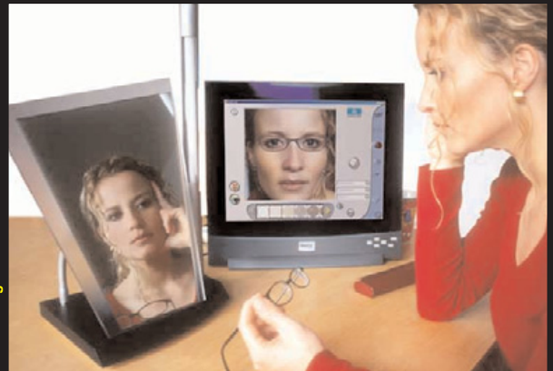
magisch und funktionell