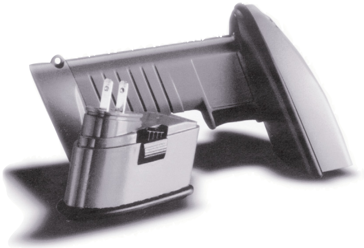
Der große Renner: der schnurlose Funk-Barcode-Leser, mit einer Reichweite von bis zu 25 Metern. So ist das Einlesen und Übertragen von Barcodes ein Kinderspiel.